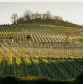
Im Landberg Monopollage