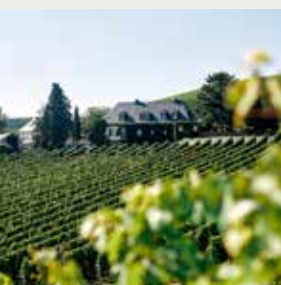
Raenthaler Gehr & Baiken Steillage

„Der Steinberg ist ein Teil meiner Heimat. Bereits die Mönche haben vor vielen hundert Jahren erkannt, welche großartige Weine dieses historische und älteste Gewann "Zehntstück" im Steinberg hervorbringt. Ich mag die Aromen von weißem Pfirsich, reifen Äpfeln und feiner Zitrusfrucht, gepaart mit einer langanhaltenden Mineralik und einem salzigen Finish.“