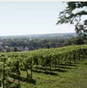
Wiesbadener Neroberg Monopol Steillage