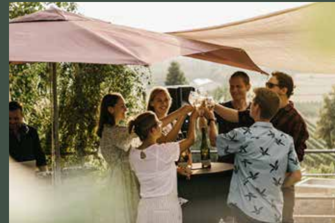
Domäne Bergstraße Wein & Genuss

Das Gebiet ist eingebettet zwischen den Flüssen Neckar, Rhein und Main. Durch die Berge des Odenwaldes ist es gegen raue Nord- und Ostwinde vortrefflich geschützt. Dadurch ergeben sich optimale Bedingungen für den Weinbau.