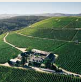
Raenthaler Baikenkopf Monopollage